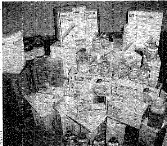
Geduldig: Ein Metallgestell fixierte Maxis Knochen (li). Allein für Pflegemittel zahlten die Eltern über 5000 Euro